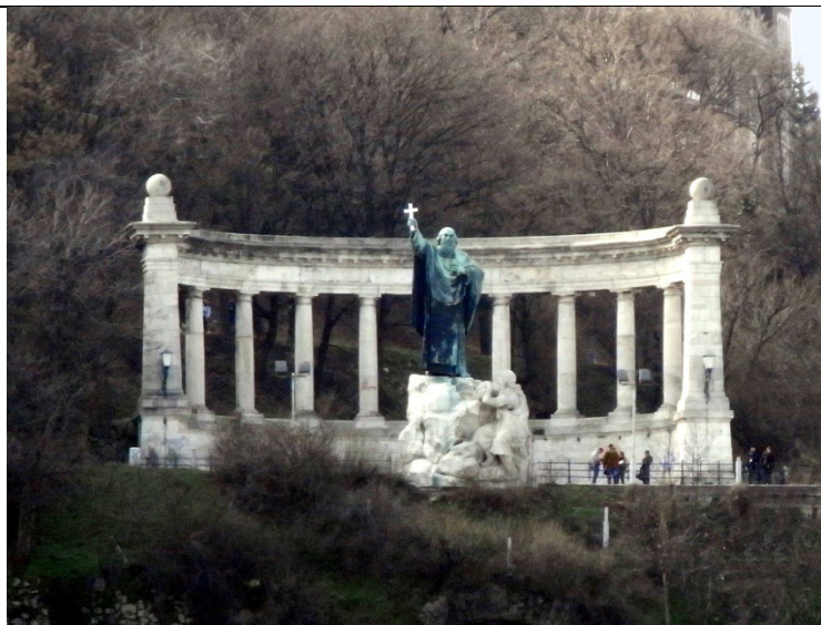
Gellérthegy, Szent Gellért Emlékmű